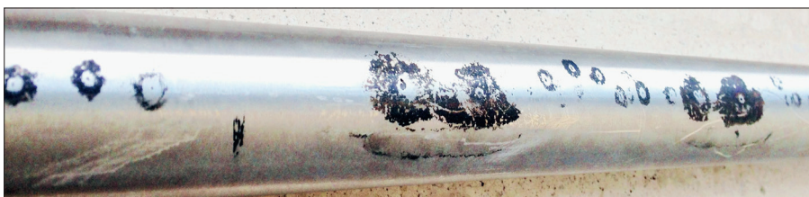
Abb. 3: Lochkorrosion im Bereich einer Rohrlängsnaht

Zu verwendendes Material sollte zu 100 Prozent einer Wareneingangsprüfung unterzogen werden, die sehr einfach sein darf. Bei vorgefertigten Baugruppen oder Funktionseinheiten sollte die Wareneingangsprüfung analog durchgeführt werden. Die Art der Wareneingangsprüfung sollte vertraglich vereinbart werden. Zur Wareneingangsprüfung gehört immer eine Sichtkontrolle. Kontaktkorrosion inkl. „Flugrost“ sollte zur Ablehnung führen dürfen. Rohre und Rohrformstücke weisen immer eine gewisse Ovalität auf. Auch Abweichungen im Rohrfumfang kommen in der Praxis vor. Ovalität wird während der Montage durch entsprechendes Werkzeug bis zur Verschweißung „ausgeglichen“. Dabei wird das Rohr oder Rohrformstück jedoch nicht bleibend verformt, sondern unter entsprechender (bleibender!) Spannung fixiert. Die sehr großzügigen Toleranzen der Normen werden regelmäßig nicht eingehalten. Eine Abweichung der Rundheit sollte sich auf die Materialstärke und nicht auf eine prozentuale Abweichung des Solldurchmessers beziehen. Ein 90°-Rohrbogen, der automatisch gefertigt wurde, sollte eigentlich nicht 89° oder 92° aufweisen können, trotzdem befinden sich solche Bögen im Handel. Ob man Toleranzen vor-