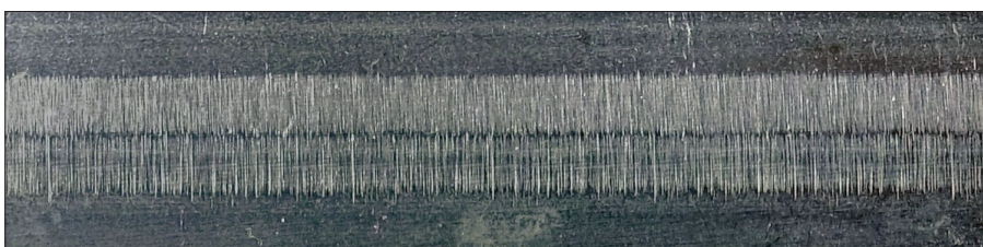
Abb. 4: Warum wird eine Rohrlängsnaht mechanisch so bearbeitet?