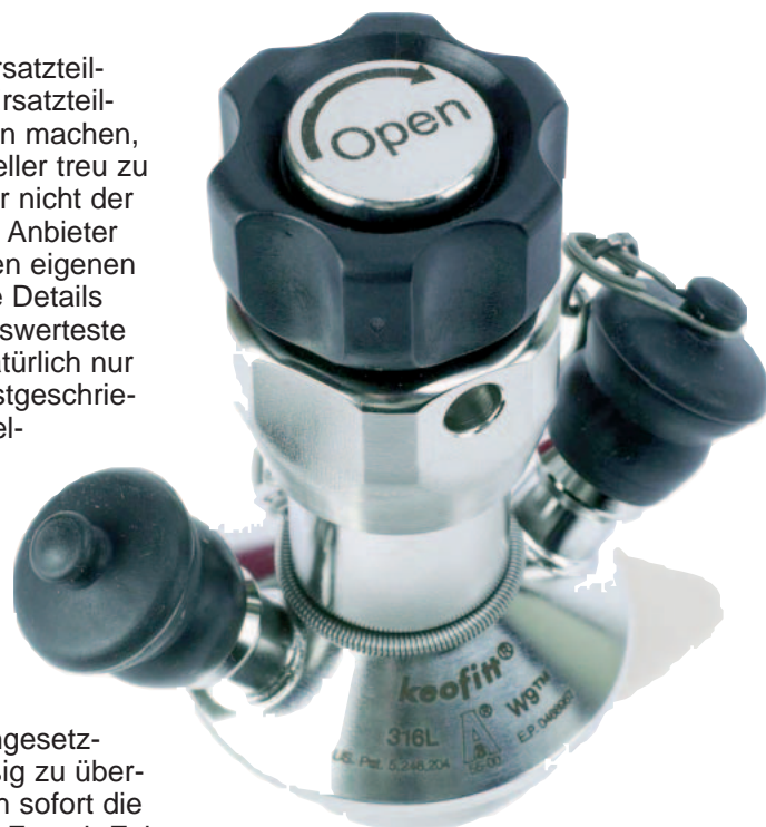
Aseptisches Probenahmeventil, Öffnung im Uhrzeigersinn, Spülverschluß mit aufgesteckten Kappen.

Nachfolgend sollen nun dem Praktiker einige Hinweise gegeben werden, nach denen er den Teilbereich einer solchen Revision, nämlich die Überprüfung, ob die Auswahlvorgaben für Armaturen noch stimmen, mit möglichst geringem Aufwand, selbst durchführen kann. Es soll Lieferanten geben, die teilweise Garantien unterschreiben, die sie nicht einhalten können. Wenn vertraglich nicht festgelegt wurde, was zu geschehen hat, wenn nicht vertragsgemäß geliefert wird, müssen im Falle der Fehllieferung die Gerichte entscheiden. Da die Gerichte jedoch das Gesetz anwenden, fühlen sich die Brauereien nach ihrem eigenen Rechtsempfinden von den Gerichten häufig ungerecht behandelt. Die Zeit, die man aufwendet, um genau zu beschrei-