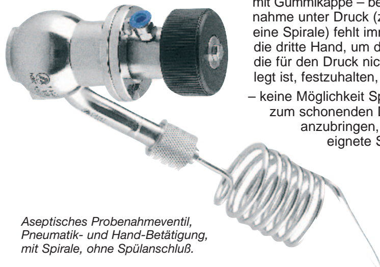
Aseptisches Probenahmeventil, Pneumatik- und Hand-Betätigung, mit Spirale, ohne Spülanschluß.

Der überwiegende Teil der im Einsatz befindlichen Probenahmeventile genügt heutigen Anforderungen nicht. Da man aber im allgemeinen keine offensichtlichen Probleme mit den installierten Probenahmeventilen hat, begnügt man sich auch bei neuen Installationen, aus durch Zeitmangel hervorgegangener Gedankenlosigkeit, mit einer eigentlich inakzeptabel schlechten Lösung.