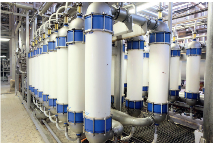
Filteranlage – Technische Abnutzung fast linear

Der Bilanzwert hat deshalb selten etwas gemeinsam mit dem Preis, der für eine Sache bezahlt wird.