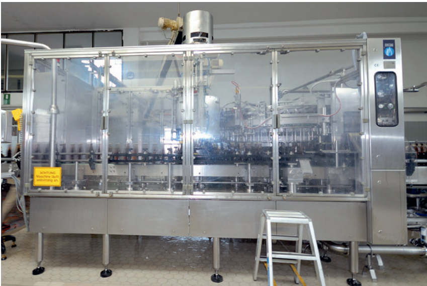
Füller – hohe wirtschaftliche Abnutzung nach Liquidation des Herstellers