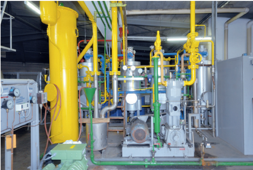
CO 2 -Rückgewinnungsanlage seit 50 Jahren im produktiven Einsatz