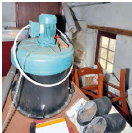
Kuriose Konstruktionen richtig einordnen.

Die großen Prüforganisationen beschäftigen Gutachter und Sachverständige. In der Praxis werden die Begriffe selten differenziert verwendet. Jeder Sachverständige ist auch Gutachter, aber viele Gutachter sind keine Sachverständige. Die IHK meint zu den Begriffen*):