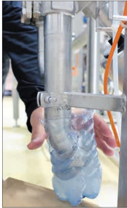
Hypothesen durch einfache Mittel prüfen.

Je früher ein Fehler erkannt wird, desto früher kann er korrigiert werden. Praktisch alle Sachverständigen bieten Beratung an. Wenn ein Sachverständiger sich die Anfrage (= das Lastenheft) für die geplante Beschaffung einer Anlage oder Maschine anschaut, bevor die Anfrage zum