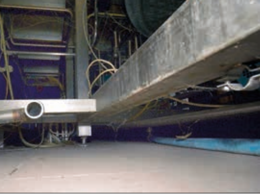
Indizien bewerten: Schlauch, verwaiste Rohraufhängung, Schweißanlauffarben

sehr teure Überholung fällig wird, um die Maschine wieder produktiv einsetzen zu können. Aber auch ohne abnehmende Arbeitsgüte können durch Abnutzung teure Überholungen in bestimmten Intervallen erforderlich werden.