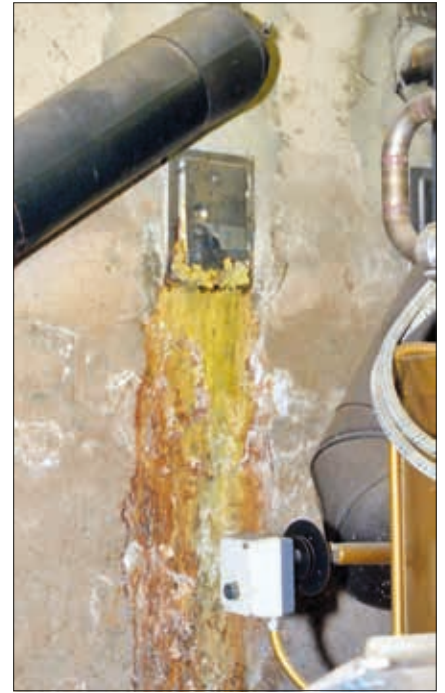
Hinweise auch neben den begutachtenden Teilen erkennen.

Lieferanten geschickt wird, zahlt sich dies fast immer aus. Meistens wird ein Sachverständiger jedoch entweder bei bereits strittigen Fragen oder zur Ermittlung eines Wertes beauftragt.